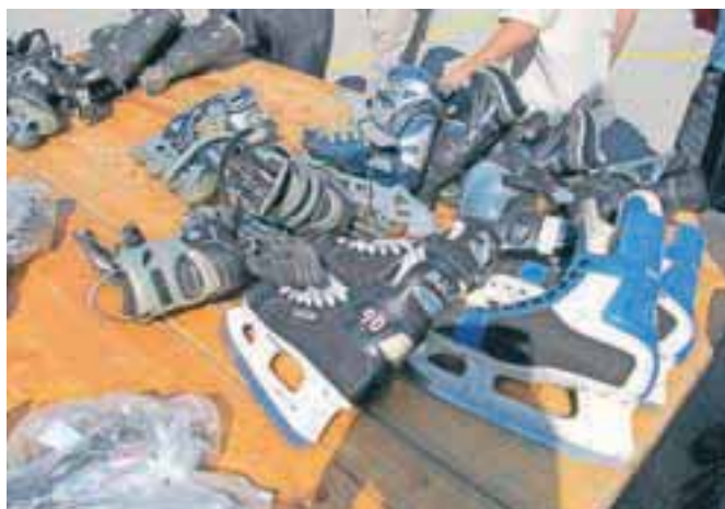
Drsalke, rolerji, športni copati, športna oblačila – vse je v hipu dobilo nove lastnike.