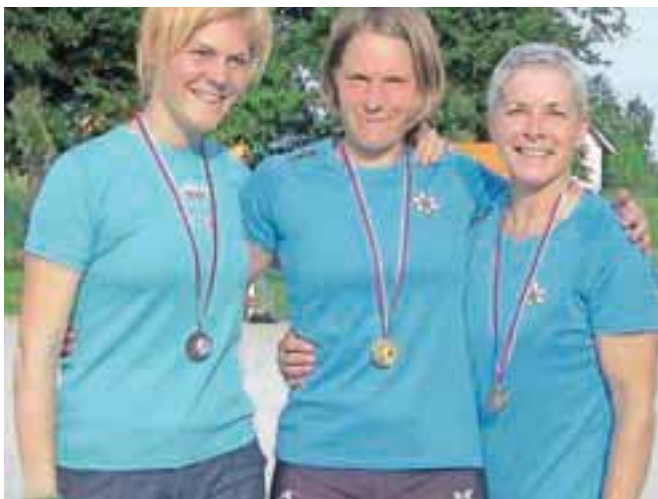
... in najhitrejše pri ženskah.

kjer sta se v zadnjem kolu srečala Jesenice in Visoko. Gostje so tekmo dobili s 3 : 2. Tretji dan maratonskega