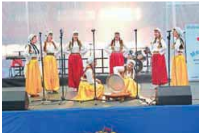
Navdušile so folklorne skupine z makedonskimi, srbskimi, bošnjaškimi in slovenskimi plesi.