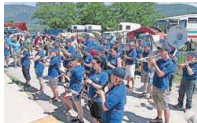
Veliko zvestobo srečanjem ohranjajo člani Pihalnega orkestra Jesenice-Kranjska Gora.