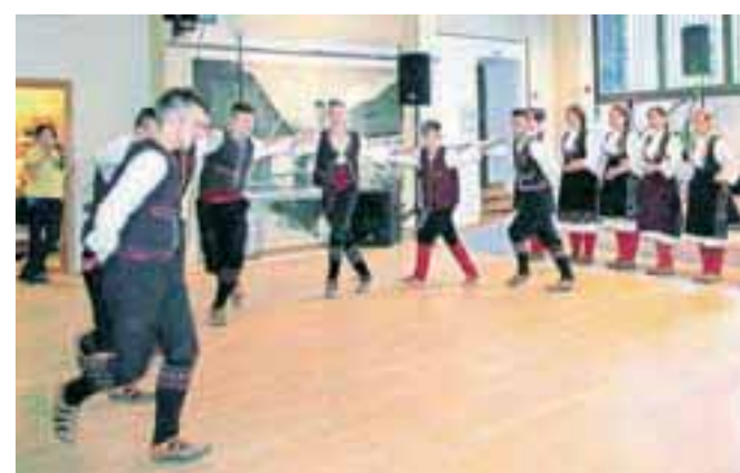
Nastop folklorne skupine Ilinden Jesenice