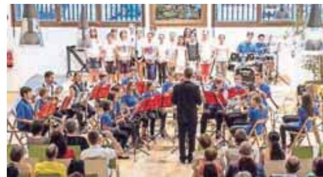
Pihalni orkester in zbor GŠ Jesenice v Kolpernu