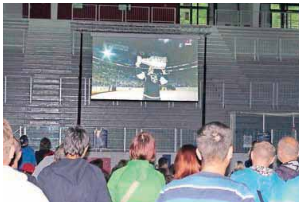
V dvorani Podmežakla so navijači spremljali vse tekme Kraljev.

Navijači so bili že ob začetku pete tekme prepričani, da bo ta tudi zadnja in da bodo še pred jutrom videli Anžeta Kopitarja, kako bo še drugič dvignil Stanleyjev pokal za najboljšo ekipo v severnoameriški hokejski ligi NHL. Ob голу Kraljev za izenačenje je bila dvorana na nogah, vendar so se strasti hitro pomirile, zamenjala pa jih je nervoza ob kar dveh