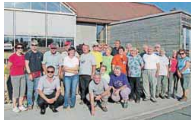
Člani PD Jesenice in PD Javornik-Koroška Bela v Trstu