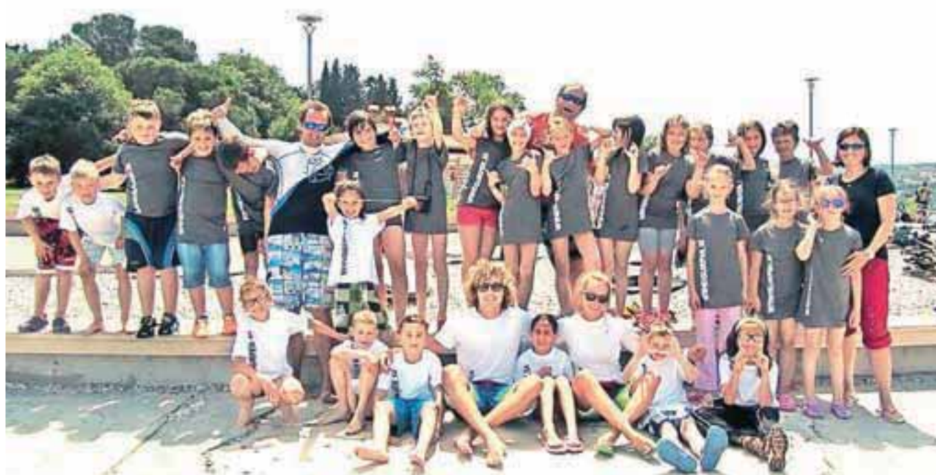
Na tečaju jadrnja na deski v Izoli

tel: 04 586 24 16 JESENICE, C. Maršala Tita 50 Brezplačno merjenje očesnega pritiska