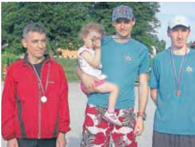
Najhitrejši v teku pri moških ...

mo v malem nogometu pomerilo šest ekip. Vrstni red prve trojice je sledeči: 1. KŠDB Biser, 2. NK Jesenice 1, 3. Splošna bolnišnica Jesenice. Zbrani množici so se predstavili tudi prstometaji (igra s ploščatimi balinci). Zanimivo je bilo tudi v Podmežakli, kjer se je bil namiznoteniški turnir. Nastopilo je devet tekmovalcev, vrstni red na vrhu pa je bil sledeči: 1. Nuša Bolte, 2. Anja Bolte, 3. Janez Bohinc. Deset kolesarjev se je napotilo proti Mojstrani, 17 pa se jih je preizkusilo v testu hoje na 2 kilometra. V soboto je bila glavna nit dneva Dan jeseniške košarke. Vse generacije so se predstavile in se družile med seboj. Odigrana je bila tudi tekma Rdeči : Beli, s 582 : 575 so zmagali Rdeči. V dvorani Podmežakla se je odvijal turnir v floorballu Thunder Cup 2014, na katerem je nastopilo 15 ekip. V finale sta se uvrstili ekipi Rovtarji in Difenders. Rovtarji so bili v polfinalu s 13 : 6 boljši od Zelencev Kranjska Gora, Defenders pa so bili s 4 : 3 boljši od Šel'c. Slednji so v tekmi za tretje mesto s 13 : 4 odpravili Zelence Kranjska Gora. Finale je pripadlo Rovtarjem, ki so bili s 7 : 5 boljši od Defendersov. Komur nista bila po godu floorball in košarka, si je lahko ogledal nogometno tekmo 1. Gorenjske lige,