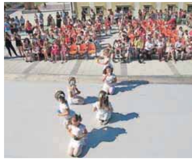
Baletna predstava na trgu pred Kolpernom