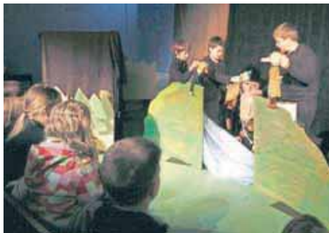
Lutkovne skupine so se predstavile v dvorani na Slovenskem Javorniku.