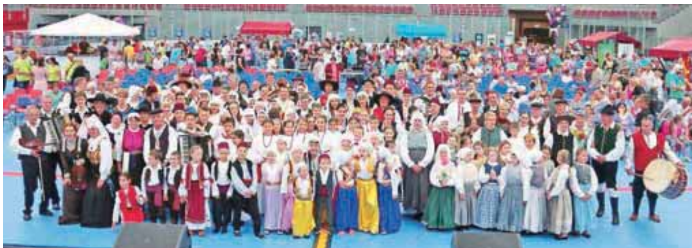
Nastopilo je več kot 250 folklornikov in glasbenikov vseh starosti.