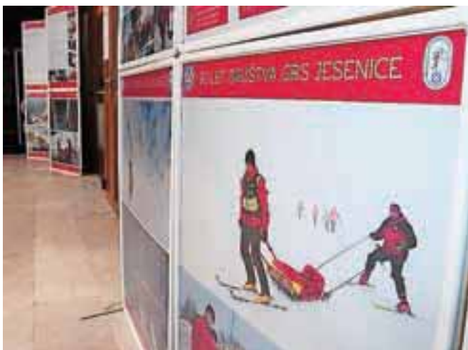
Razstava o delu jeseniške GRS je do septembra na ogled v avli knjižnice.