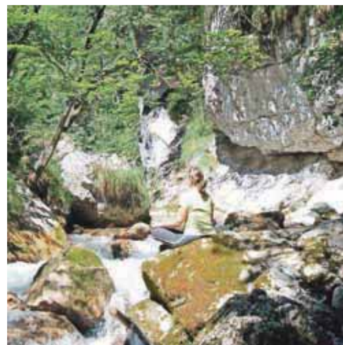
Joga je učinkovita pri lajšanju stresa, krepi gibljivost našega telesa, moč mišic in pravilno držo, izboljša se dihanje in splošno zdravje.