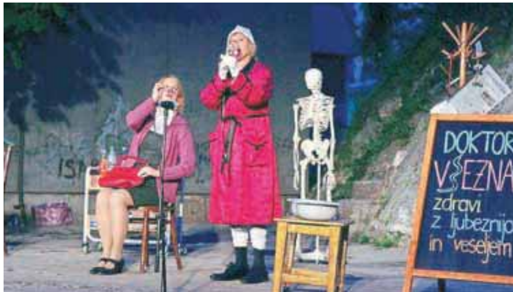
Nastopajoči profesorji so poželi bučen aplavz.